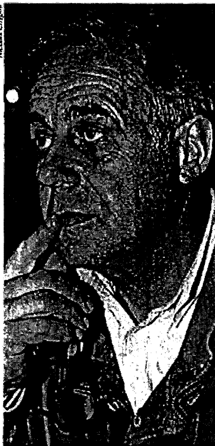
Ziegler: «Le Nobel humilie le tiers monde»